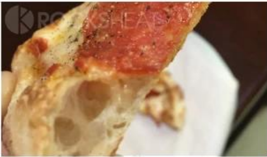
Using baking pizza stone