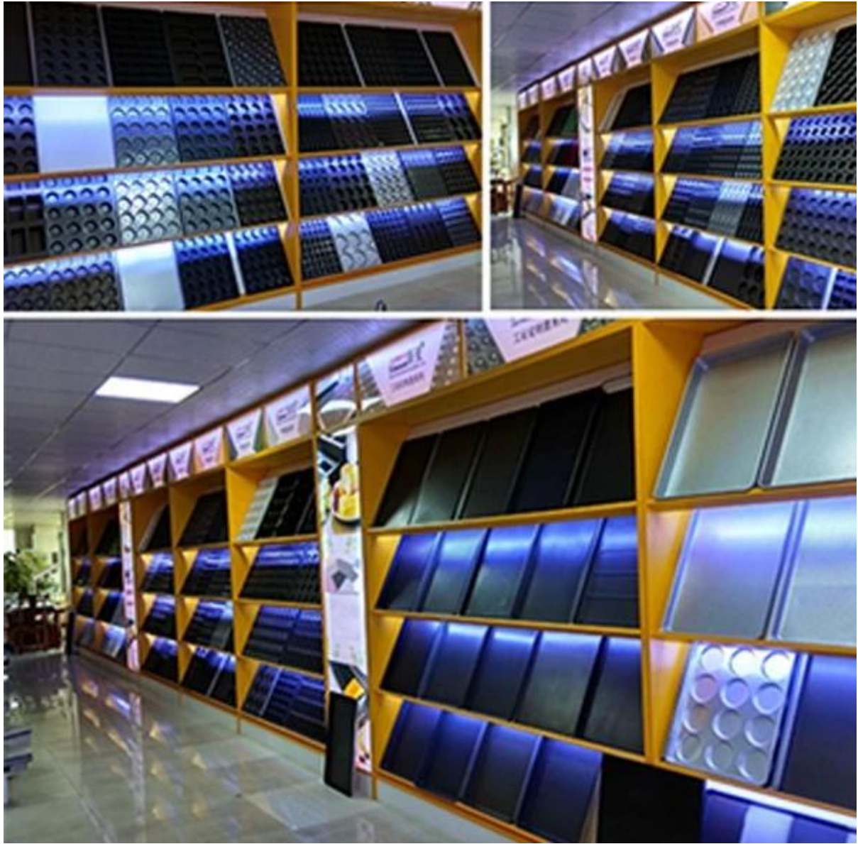
Pagbisita ng customer