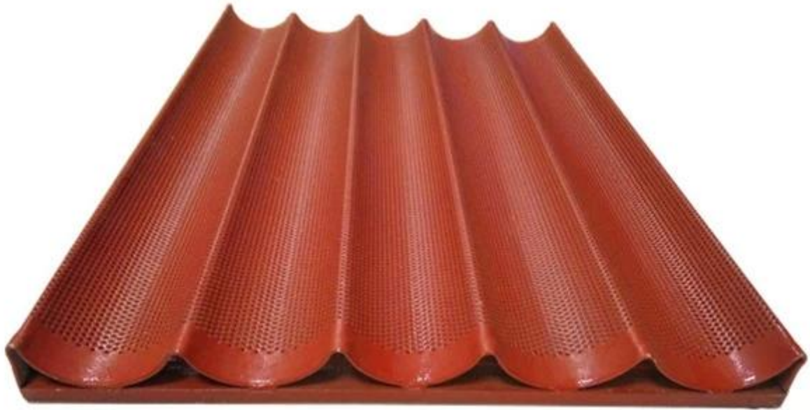
Larawan ng Aluminum Baguette Tray na may Open Frame at Silicone Coating