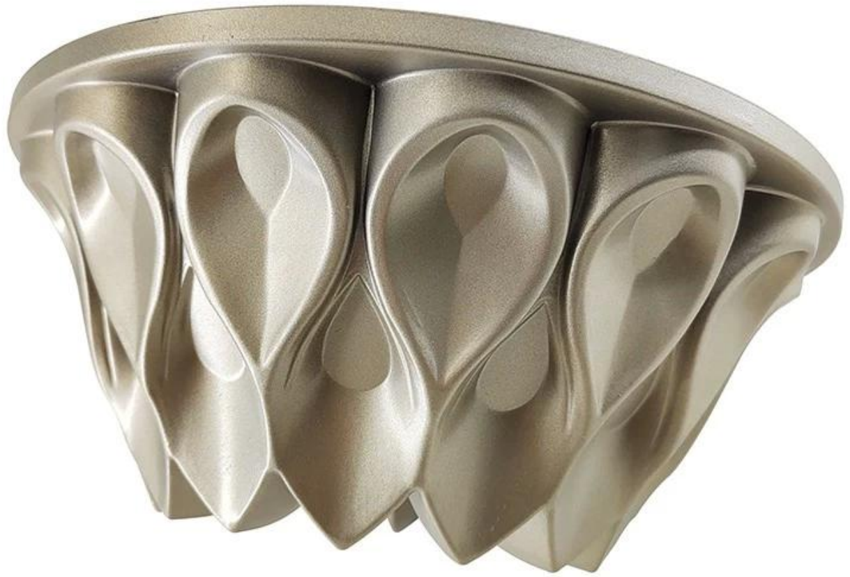
Higit pang modelo ng die cast aluminum bundt cake baking pans