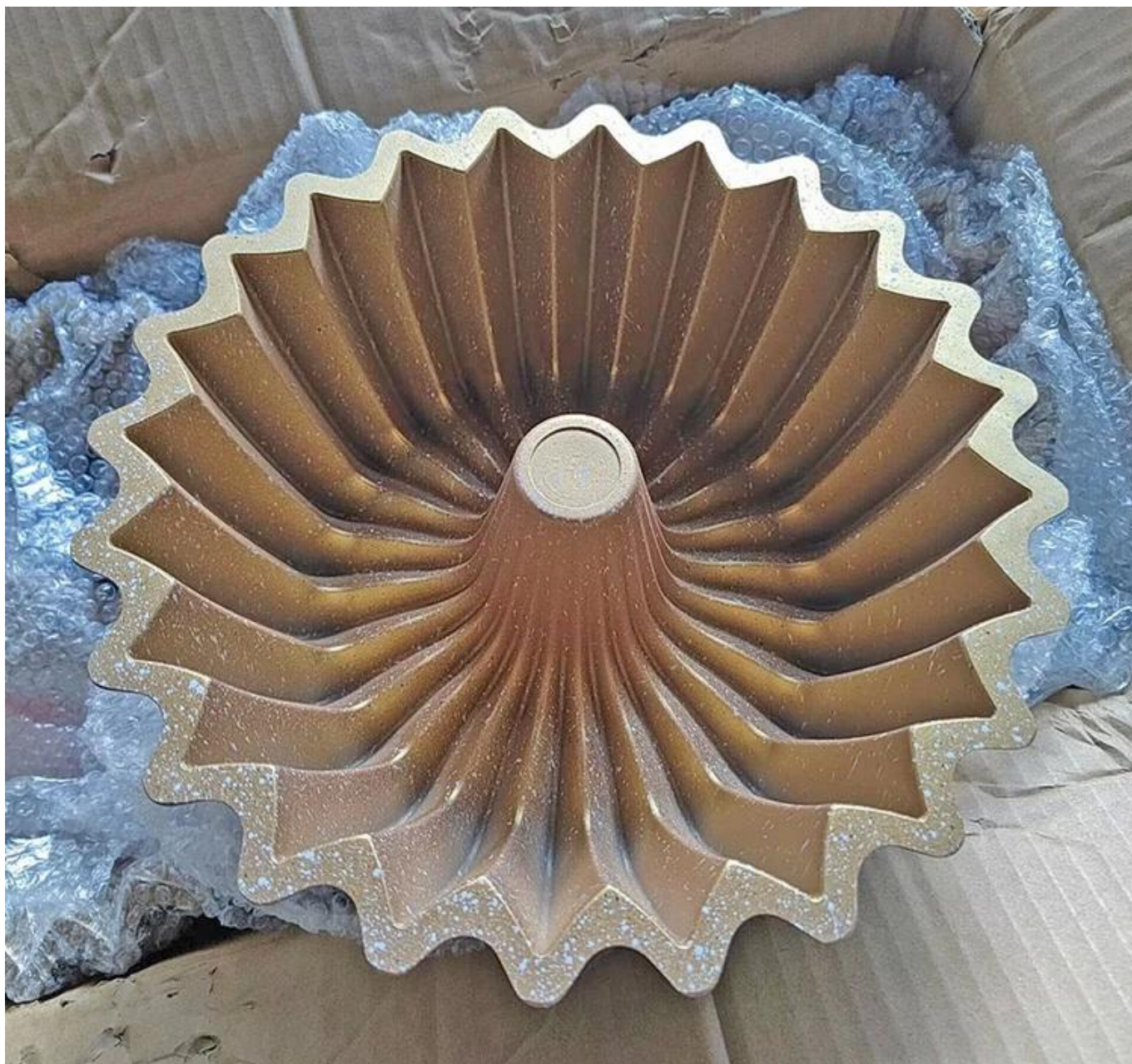
Higit pang modelo ng die cast aluminum fluted bundt cake pan 3D cake baking molds