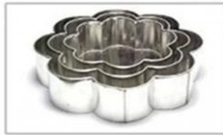
Pabrika at pagpapadala ng mga larawan