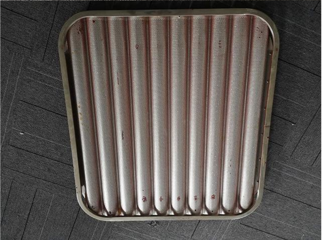
Mababang presyo aluminyo baguette tray mula sa Tsingbuy baguette tray tagagawa ay para sa pakyawan.