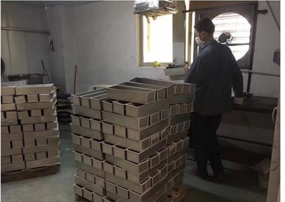
Ang aming mga baking pans na nagpapakita ng silid