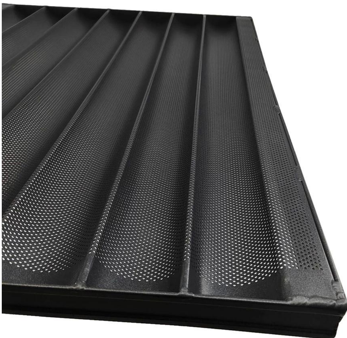
Higit pang mga pattern ng komersyal na paggamit ng aluminum baguette pan French loaf bread baking mole trays