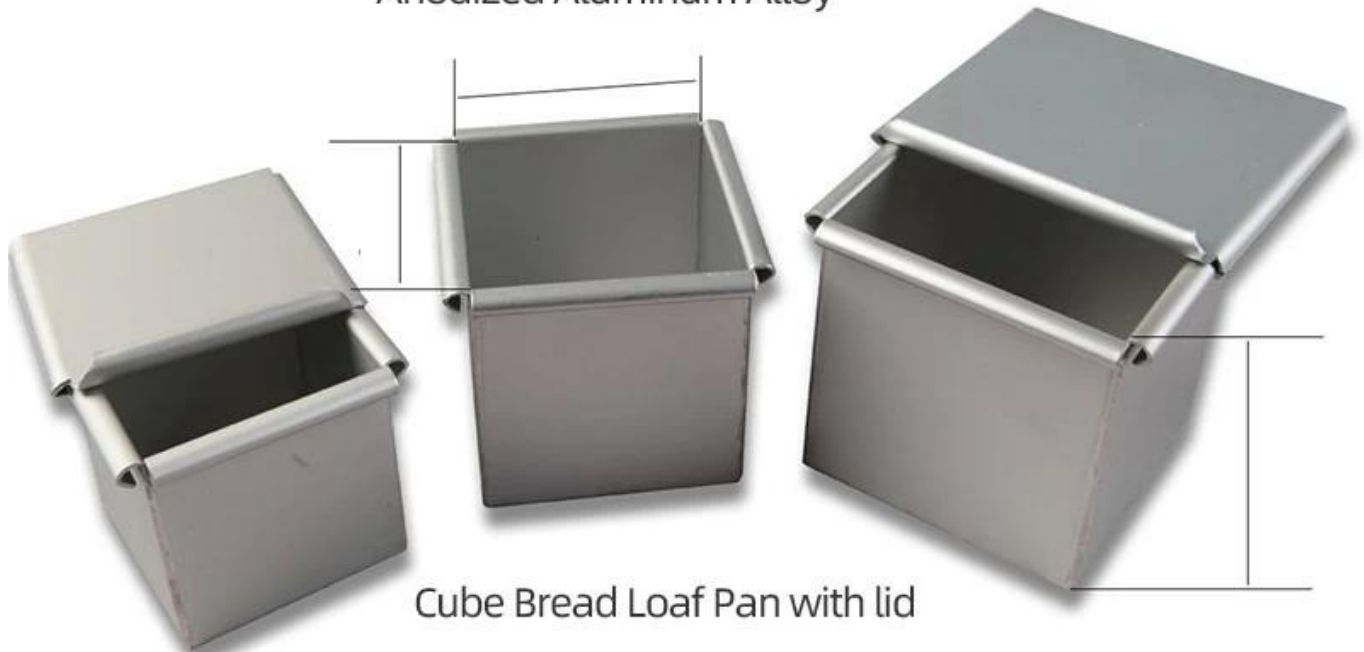
Cube Bread Loaf Pan with lid