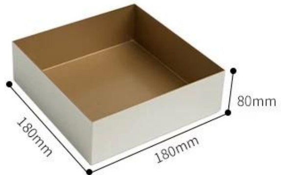
welded right corner