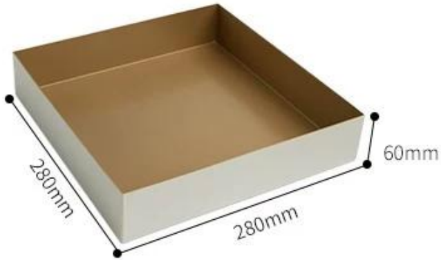
welded right corner