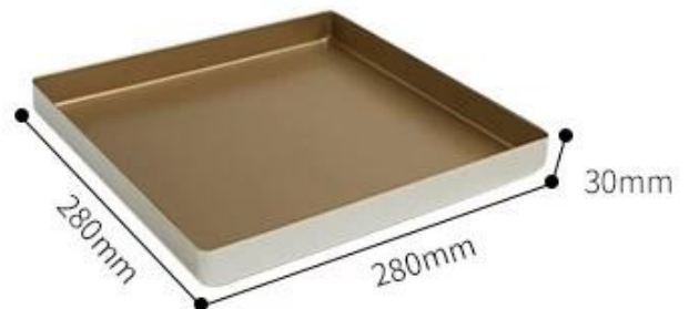
Stamp round corner