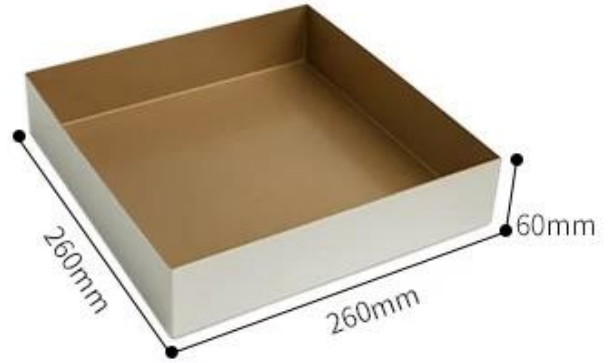
welded right corner