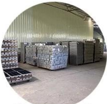
Clean & tidy warehouse