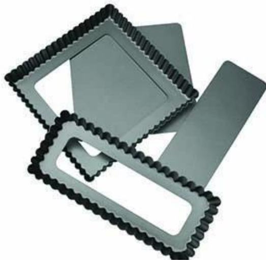
Detachable / removable bottom