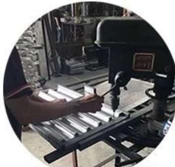
Standard production flow