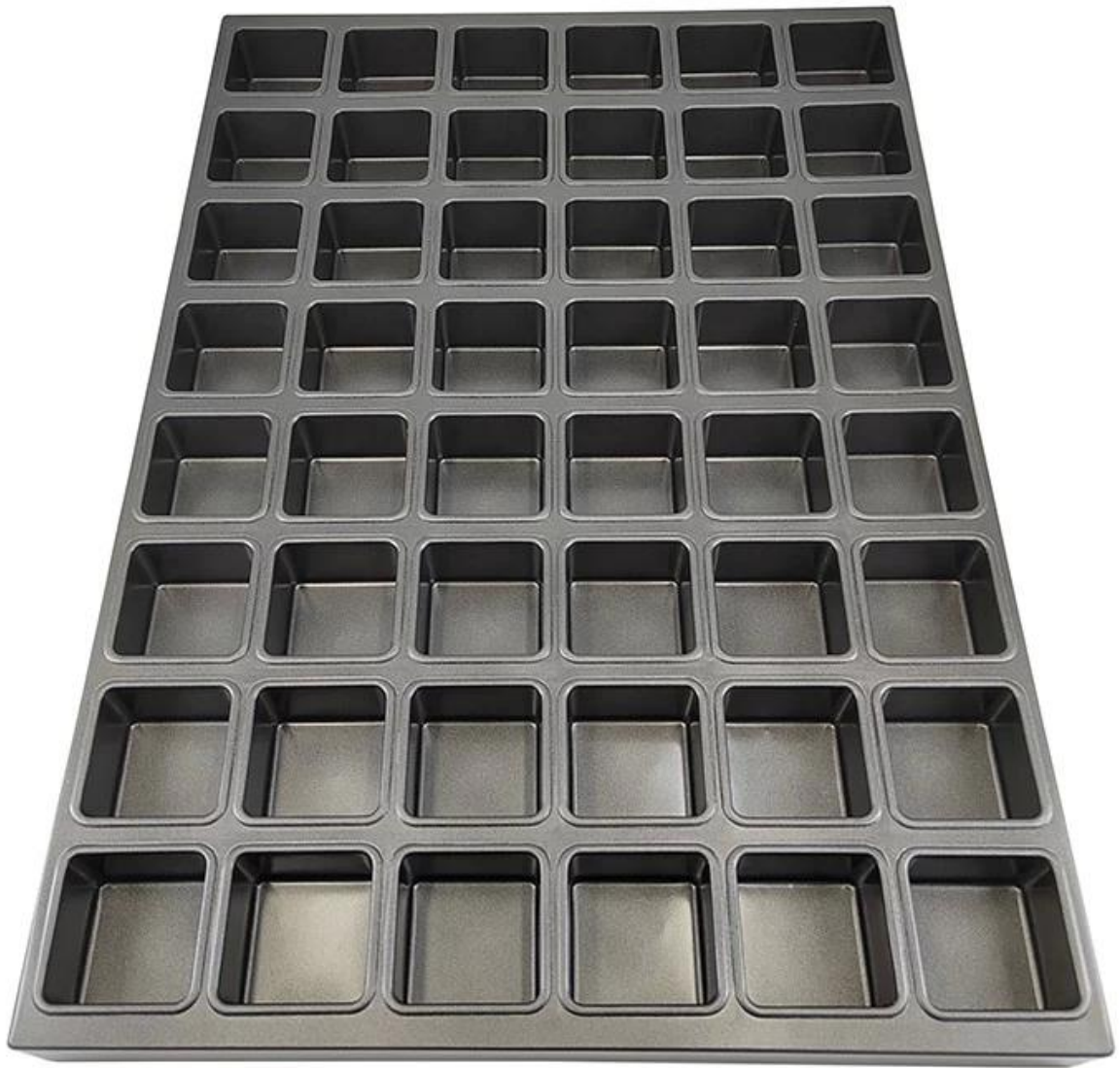
35-molds mini square cupcake muffin baking tray pan