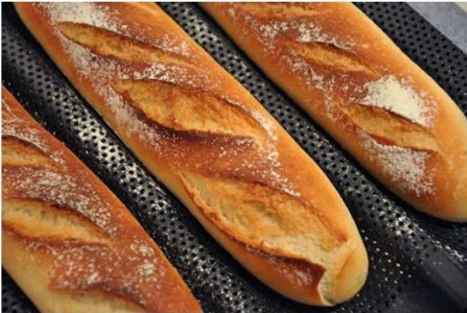
Perforated Baguette Pan