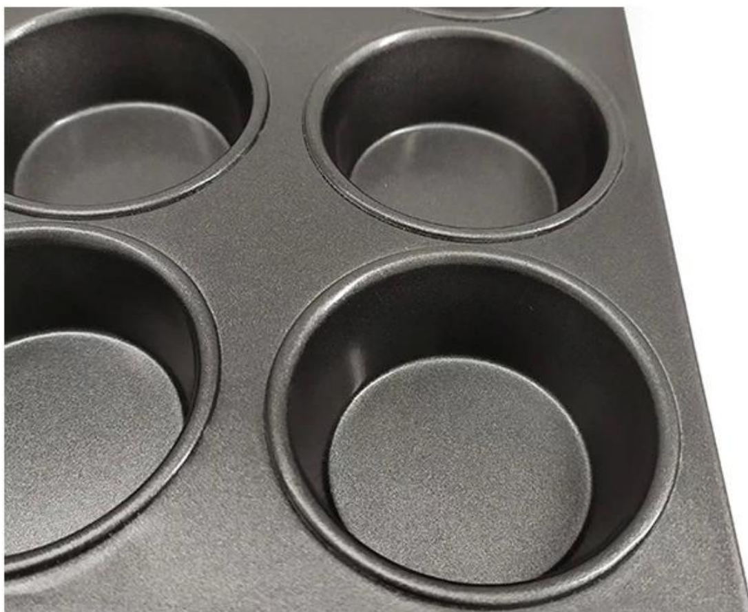
Higit pang mga uri ng hugis na mga cupcake pans