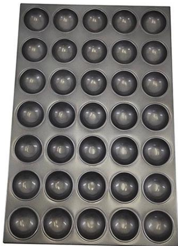
35-tin sphere muffin baking tray