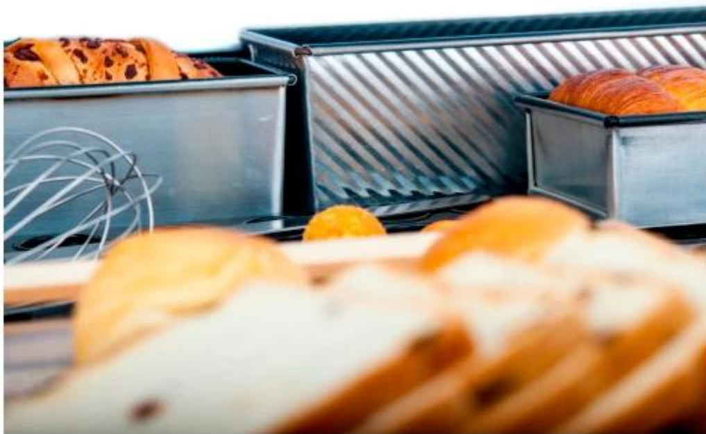
Mga larawan ng pabrika