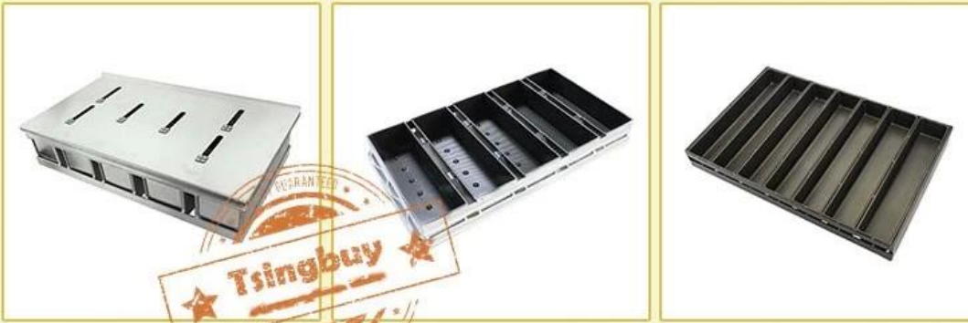
4/5 straps with lid

Available for food factory machinery lines