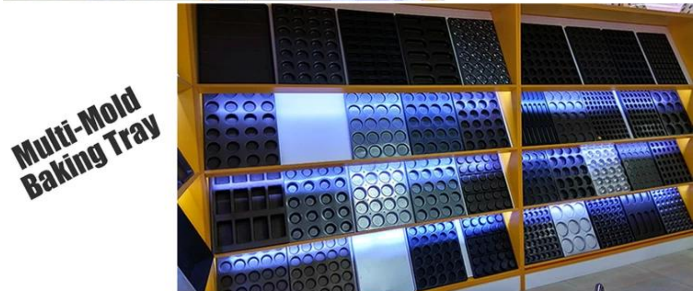
Multi-Mold Baking Tray