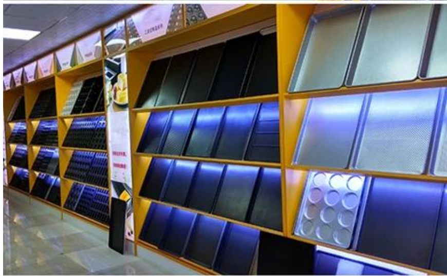
Sheet pan Drying pan