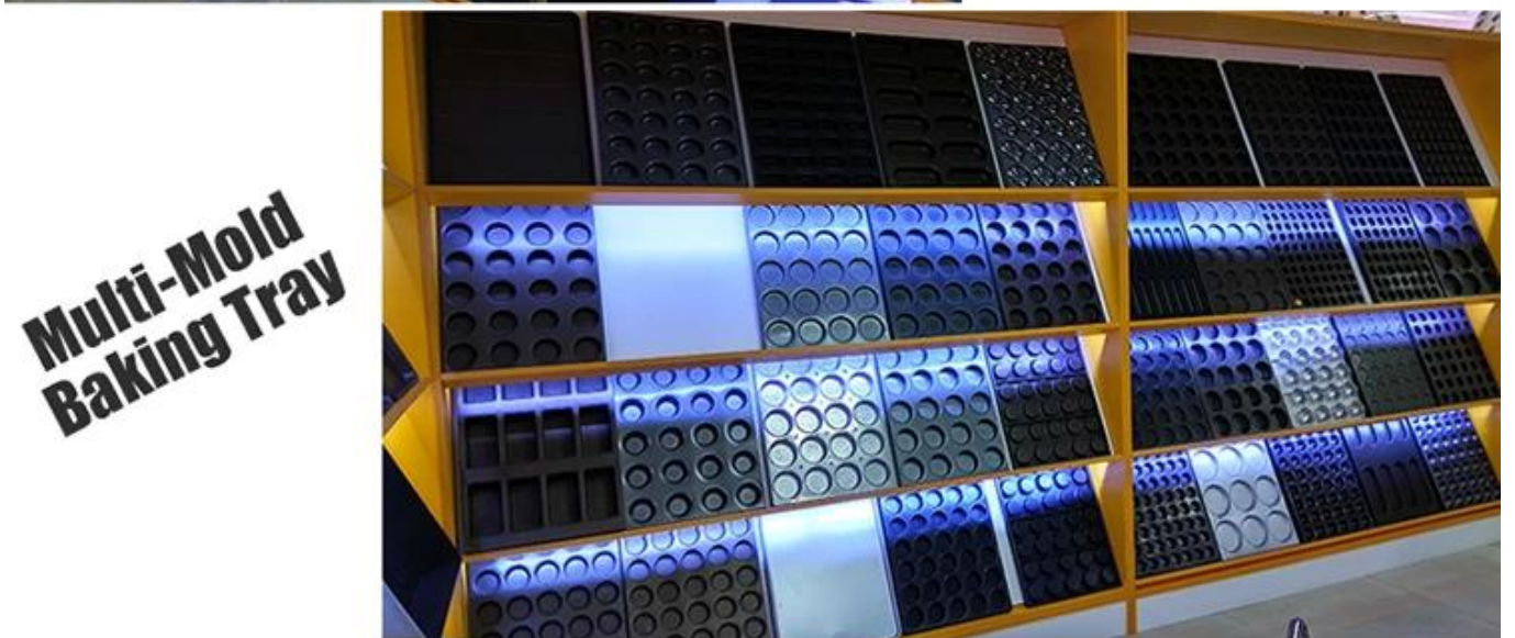
Multi-Mold Baking Tray