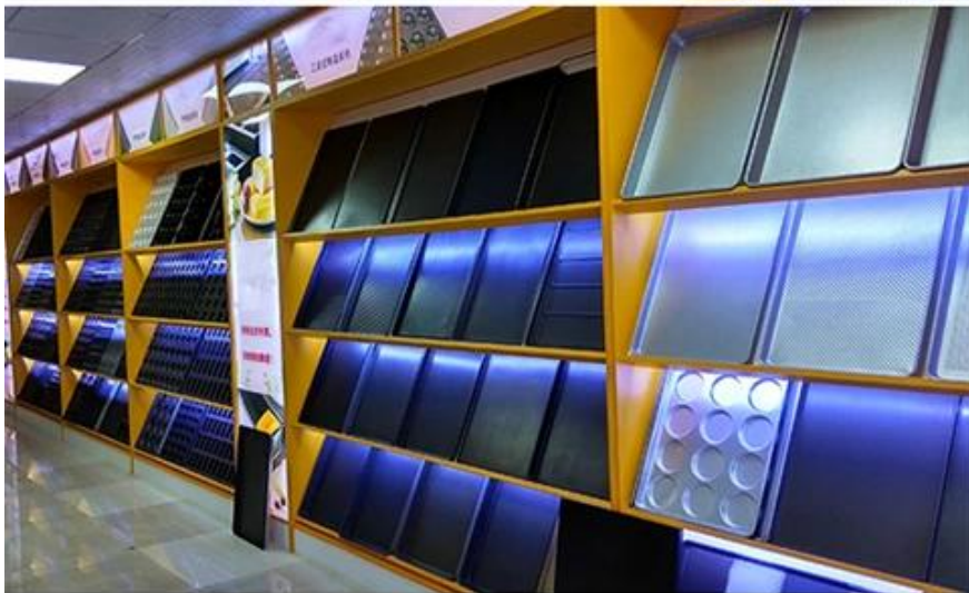
Sheet pan Drying pan