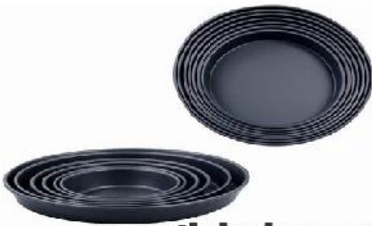
non-stick pizza pan