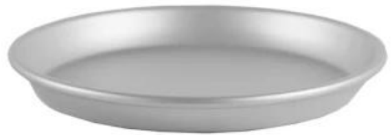
deep pizza pan