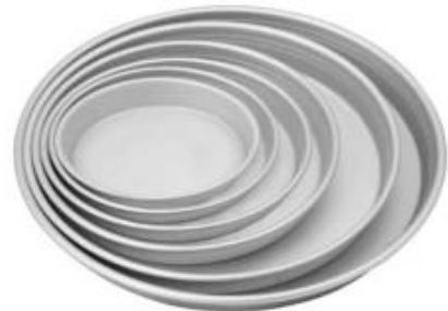
anodized aluminum alloy pizza pan