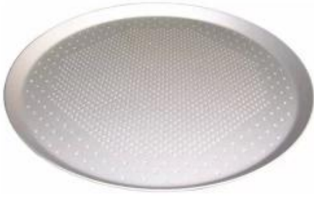
perforated pizza crisper pan