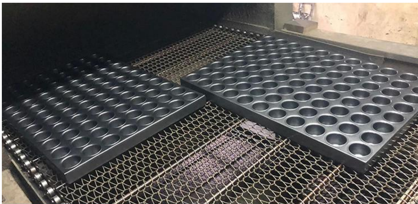
Foto di fabbrica