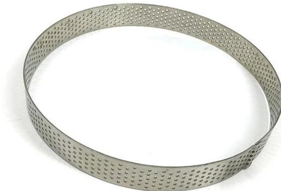
Immagine di anelli torta in acciaio inossidabile tondo traforato mousse anelli torta