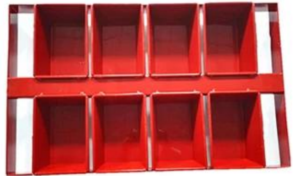
Immagine di fabbrica

Benvenuto a visitare il nostro pagnotta pane cottura al forno della fabbrica .