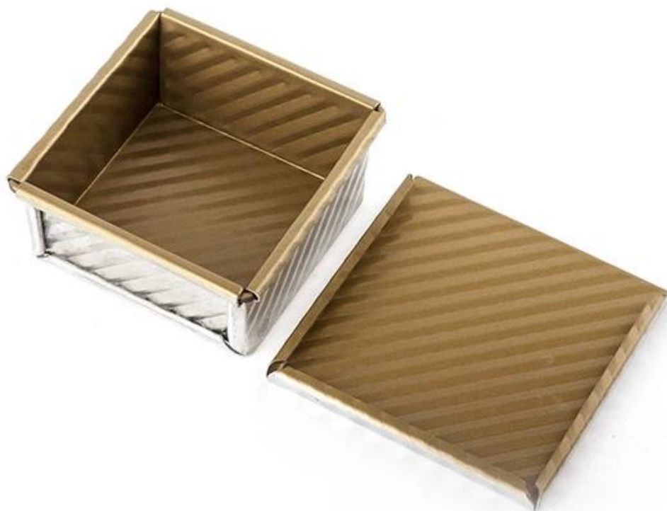
Immagine del prodotto della pagnotta del pane del pullman non-stick dorata con il coperchio