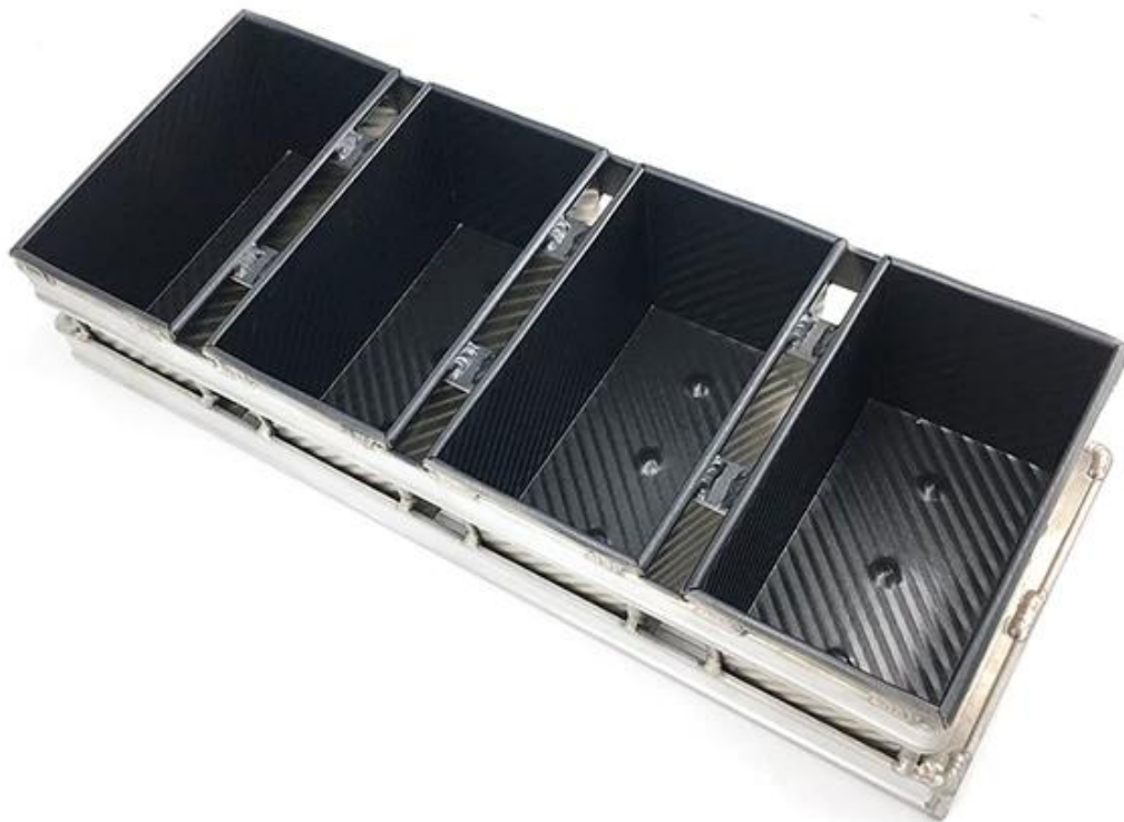
Immagine del prodotto di padella ondulata alusteel 5 cinturino