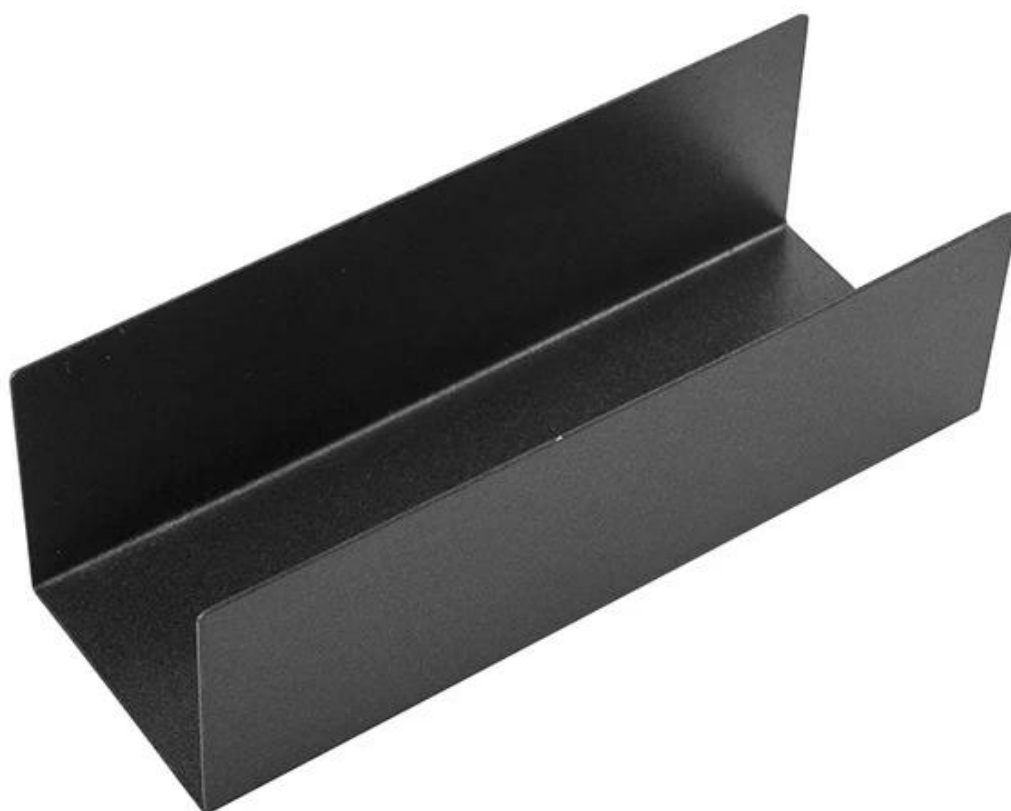
Dettagli della padella per pane in acciaio inox antiaderente a forma di U TSTP008