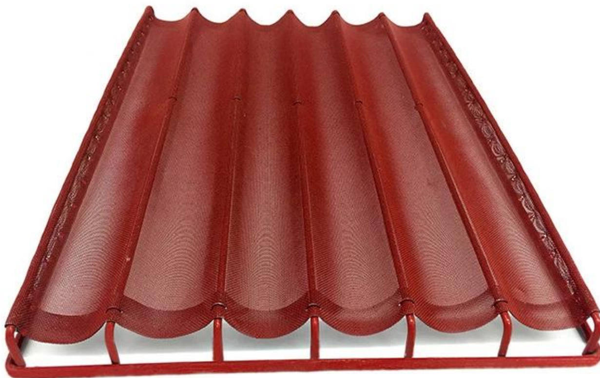
Foto di stainless Steel wira mesh Baguette traggio

Tsingbuy produce ed esporta questo tipo di teglia per baguette da oltre 6 anni ed è esperta come produttore di vassoi baguette in rete metallica . Potete essere certi della qualità e del servizio dei nostri prodotti.