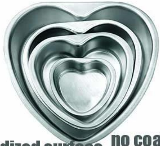
anodized surface no coating