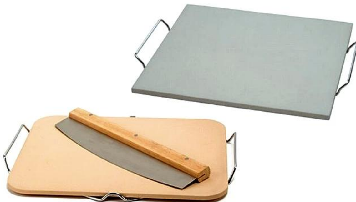
Foto di Cordierite Baking Pizza Stone Rettangolare TSPS002 & TSPS003