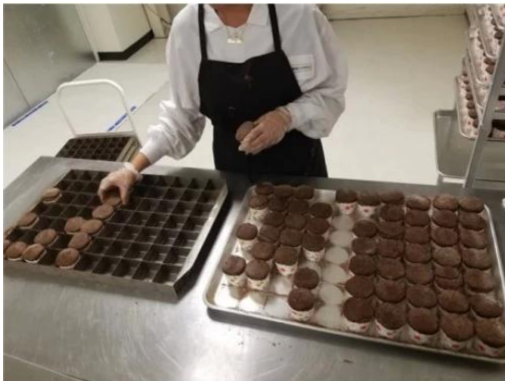
Spettacolo di fabbrica