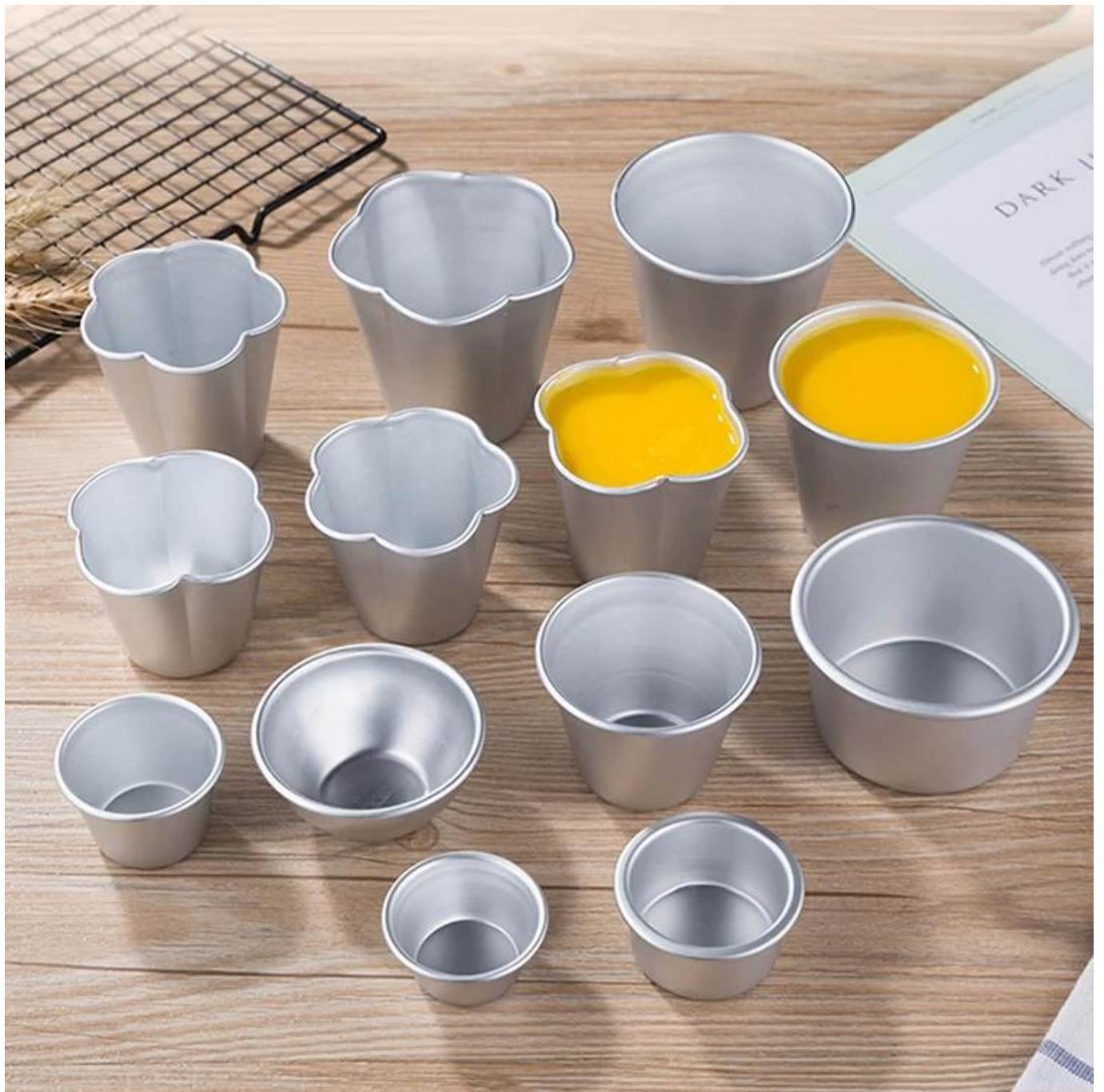
Spettacolo di fabbrica