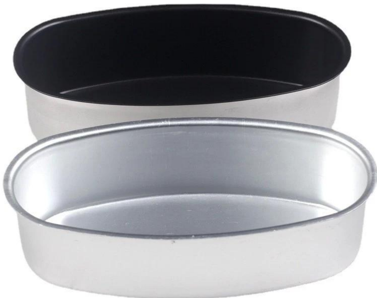
Immagine del prodotto s di tortiera albero di natale in alluminio stampo pandoro