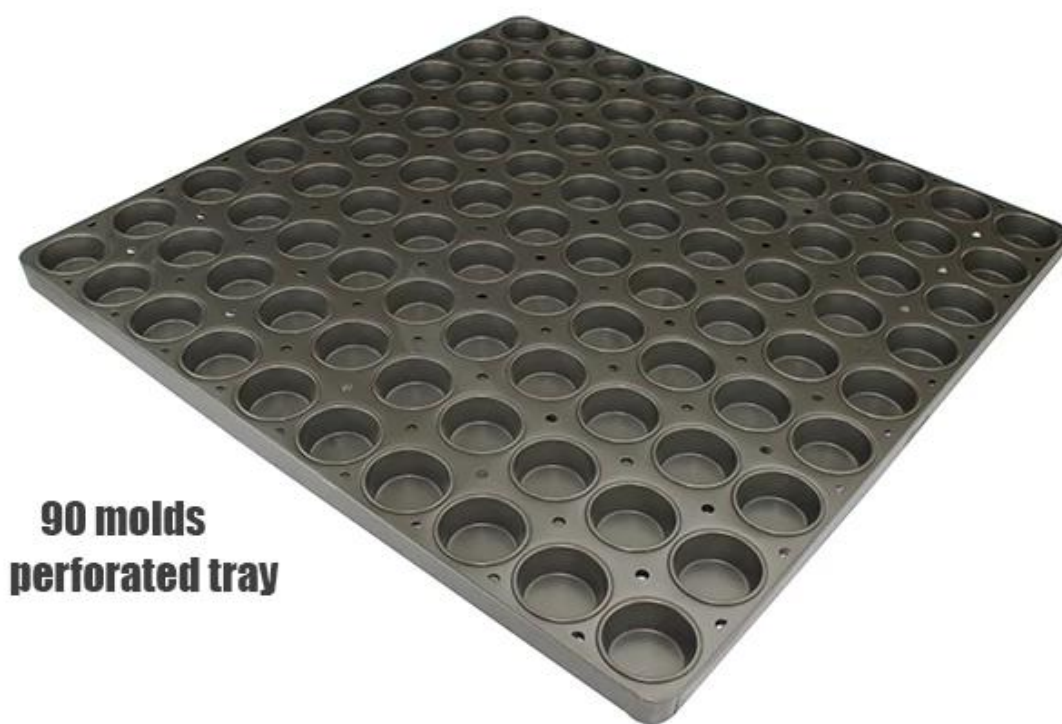
90 molds perforated tray