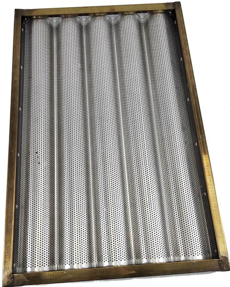
Altri modelli di teglia per baguette in alluminio Teglia per pane francese