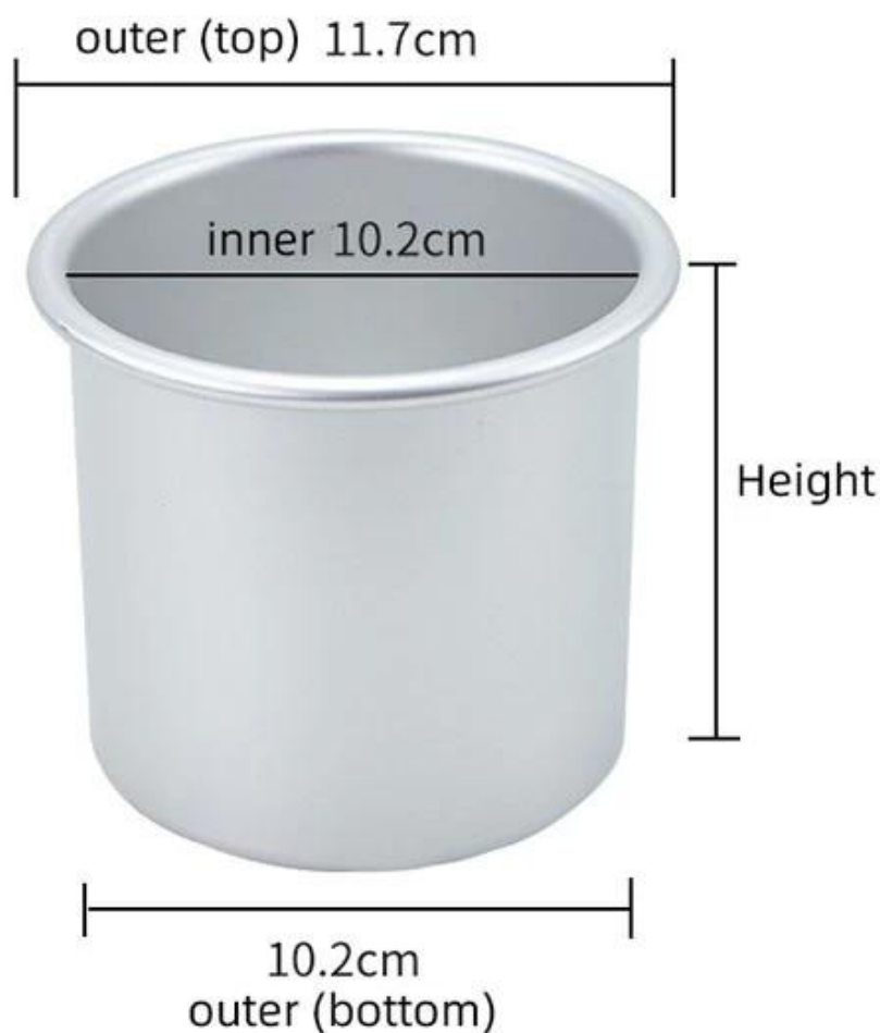
Immagine del prodotto di di Mini tortiera tonda in alluminio tonda da 4 pollici con fondo rimovibile