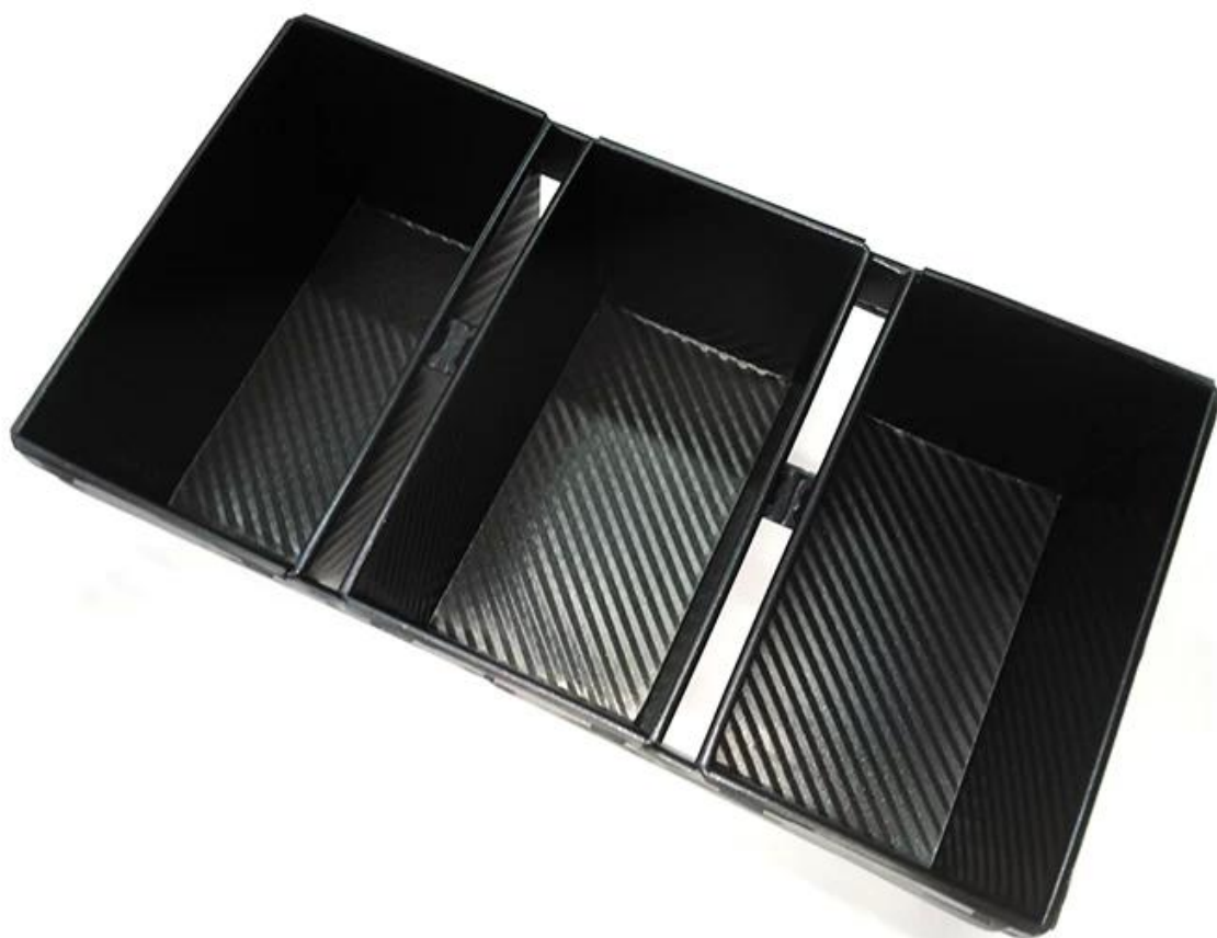
Immagine del prodotto per set di padelle per pane a 3 cinghie in acciaio alluminato