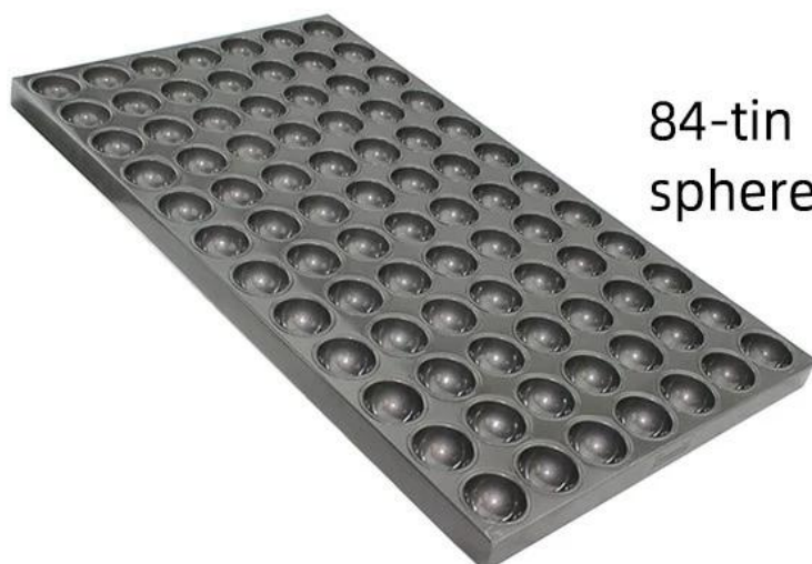
84-tin sphere molds