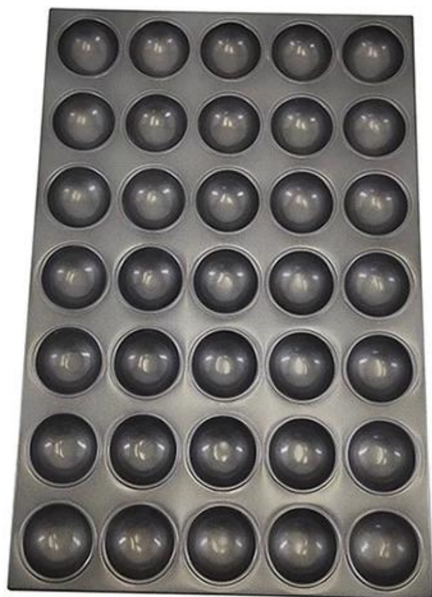
35-tin sphere muffin baking tray