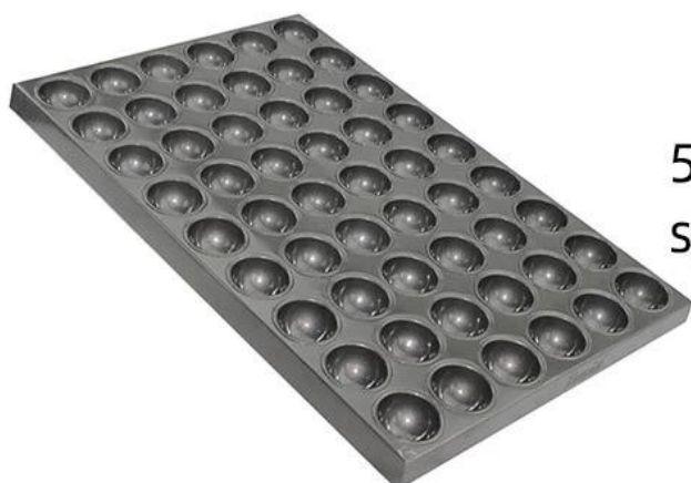
54-tin sphere molds