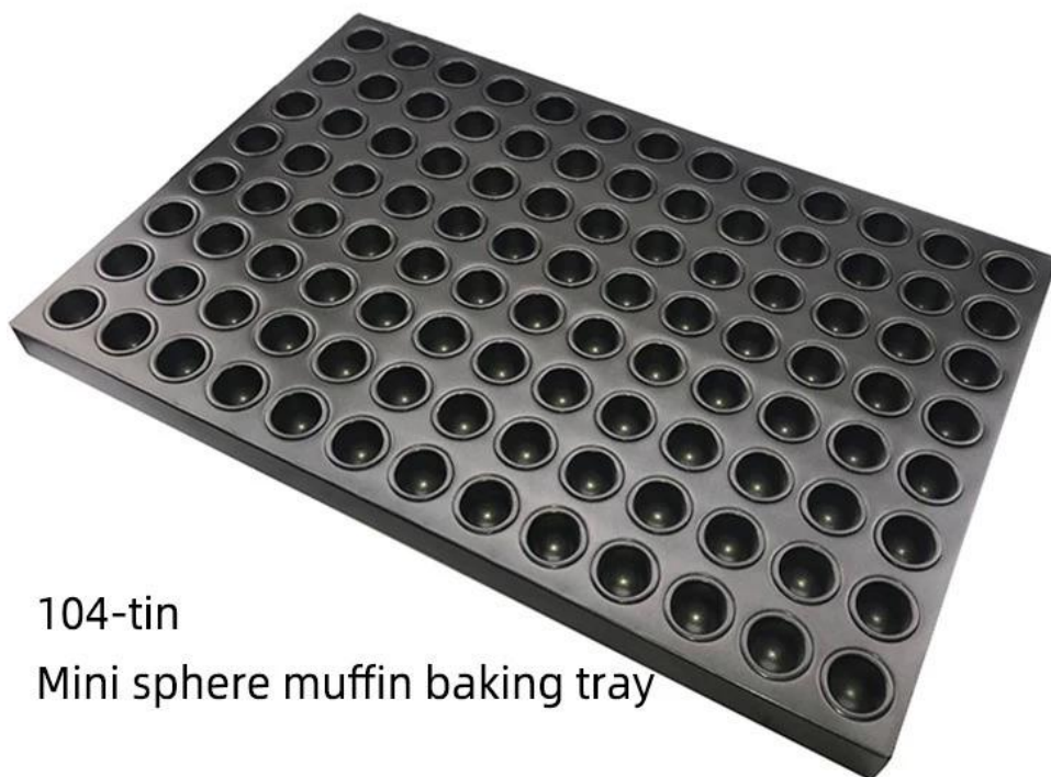
104-tin Mini sphere muffin baking tray