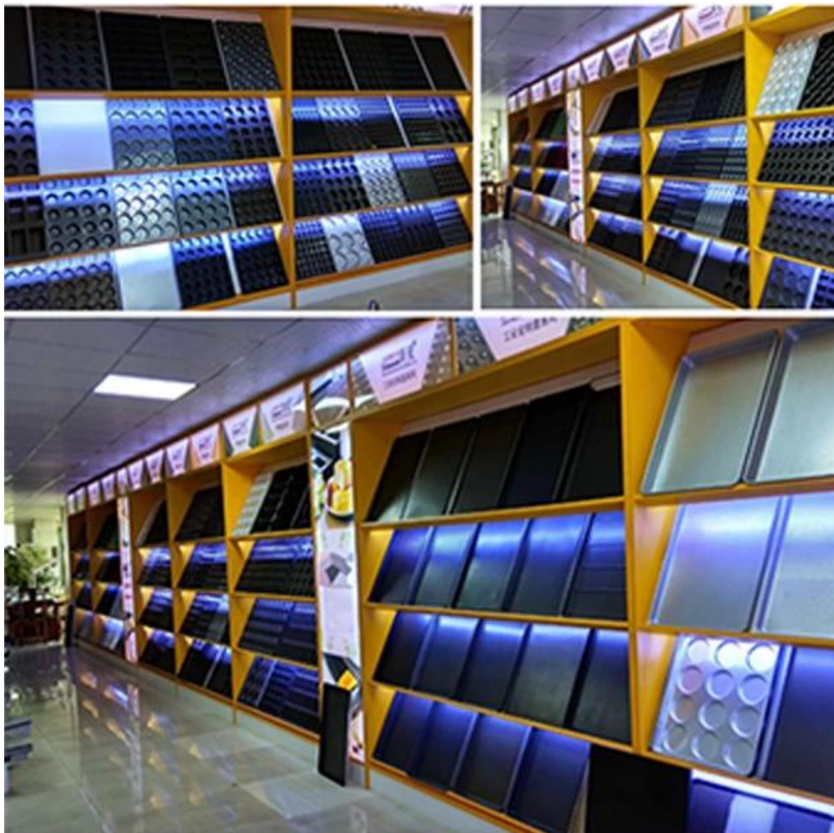
Cliente che visita la fabbrica di teglie in Cina