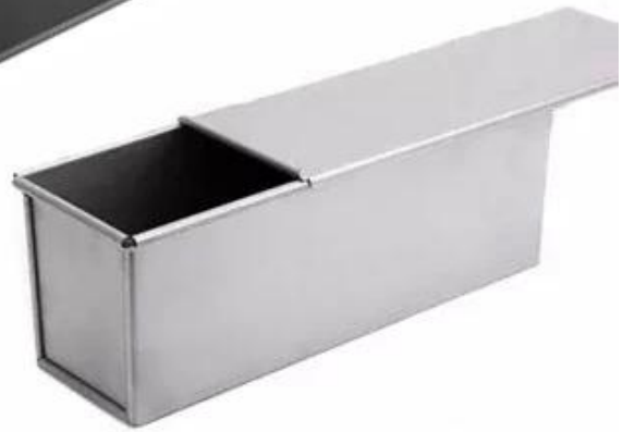
Photos de la fabrique de moules à pain