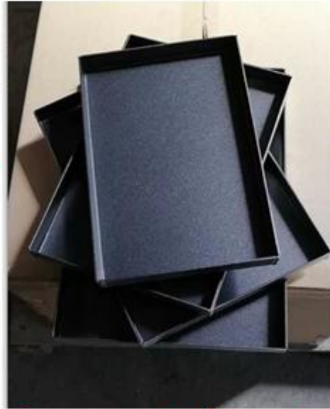
Customized size and thickness