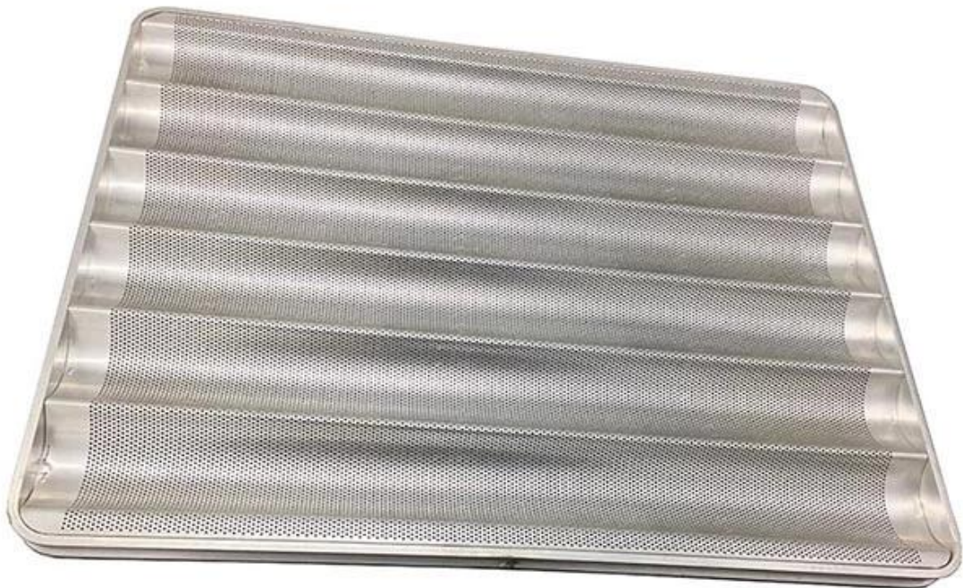
Image du produit Plateau de cuisson pour baguette de pain français à coins ronds en aluminium