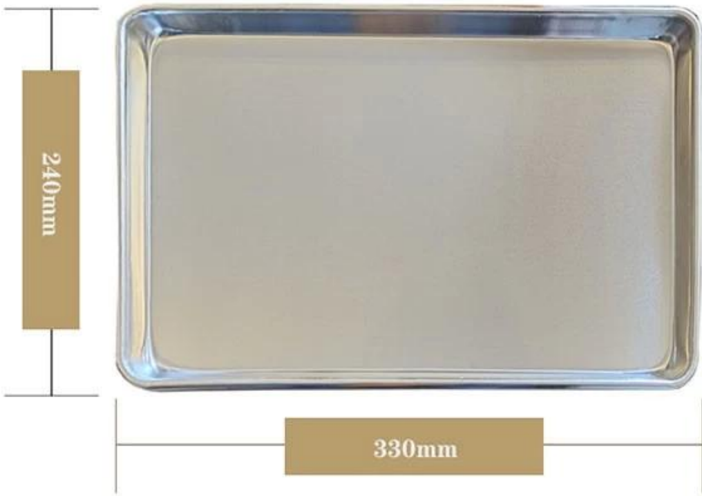
Quarter size baking sheet pan