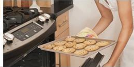
Enjoy family baking time