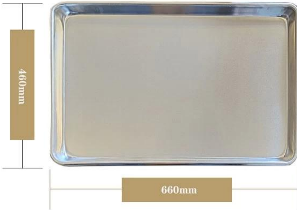
Full size baking sheet pan