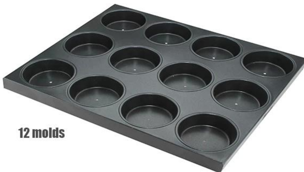
Image produits d'acier aluminisé grand moule à muffins rond