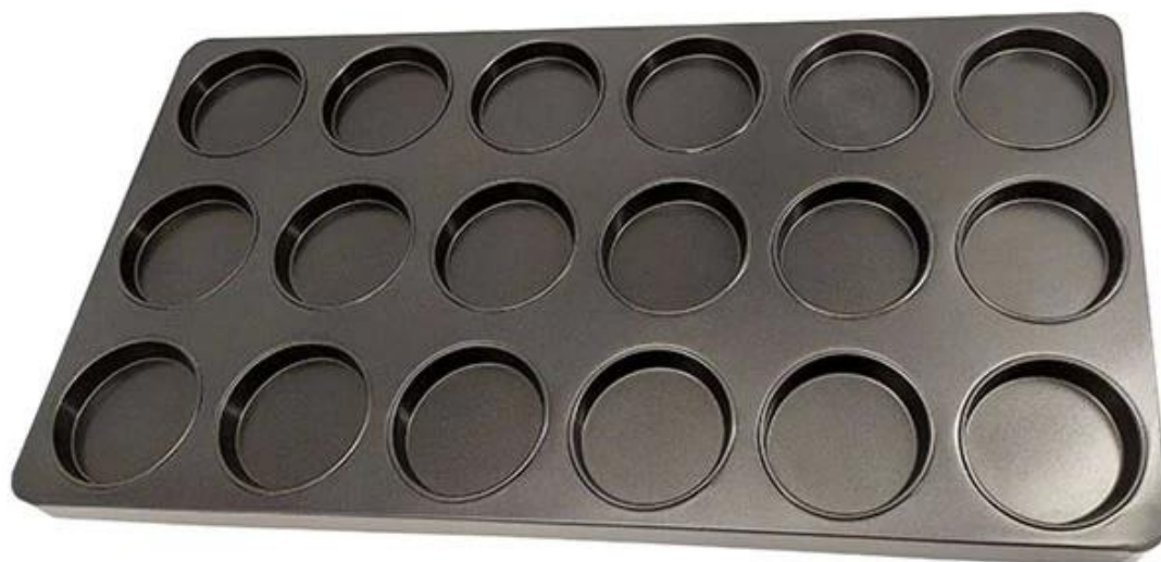
Image produits de Plat de cuisson à hamburger antiadhésif de 15 unités / grande plaque à muffins