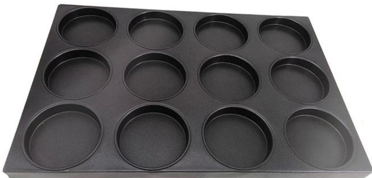
Image produits de Plat de cuisson pour hamburger antiadhésif, 12 unités