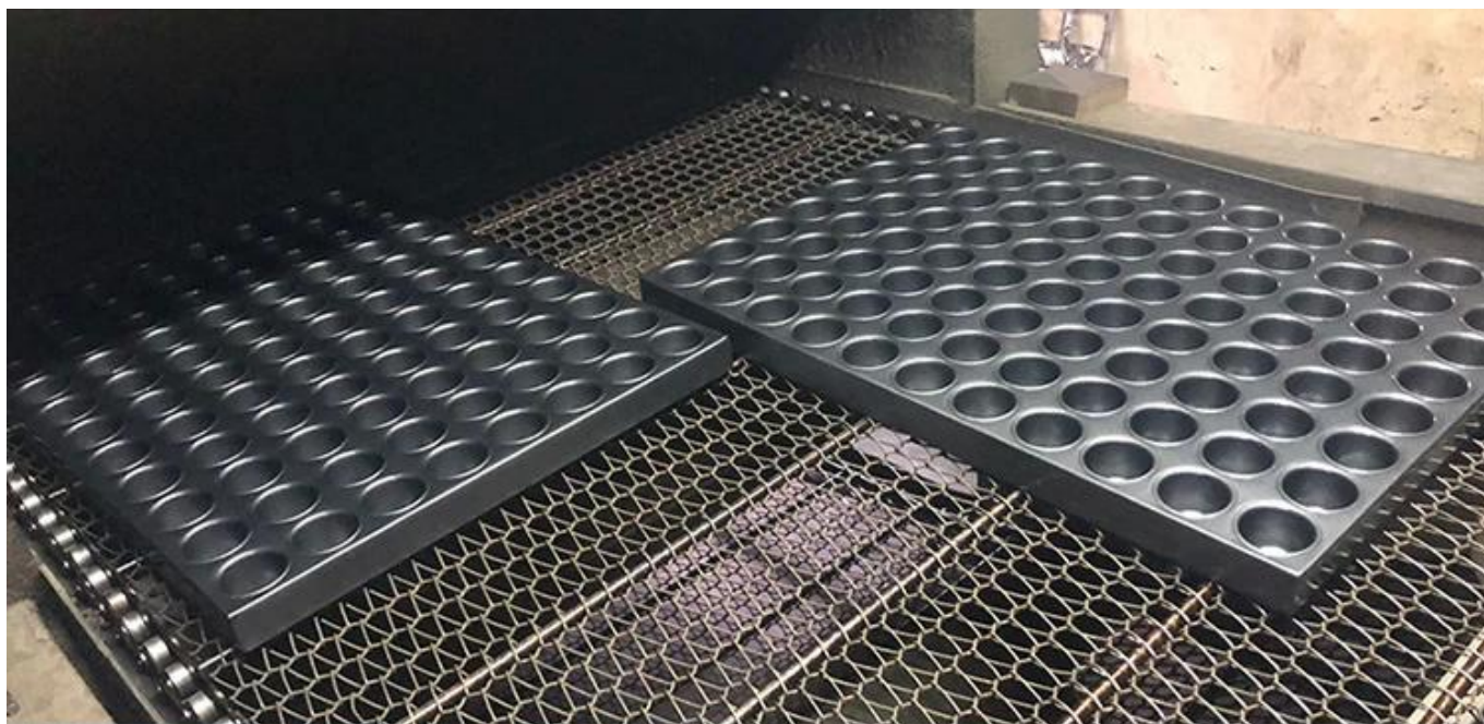
Images d'usine de plaque de cuisson multi-moule antiadhésive et montrant la pièce