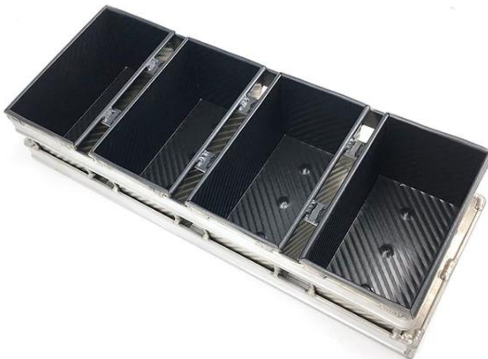
Image du produit du moule à pain en sangle alusteel 5 ondulés