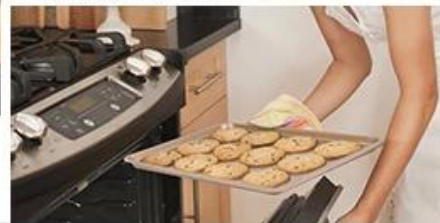
Enjoy family baking time