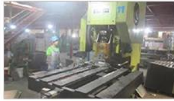
Automatic punching machine