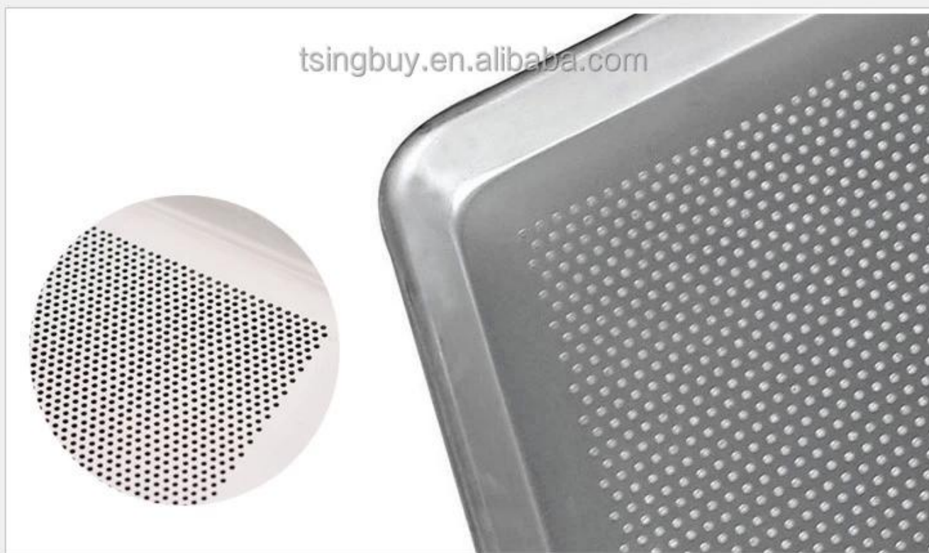
Perforation is optional, for better air flow and quicker baking.