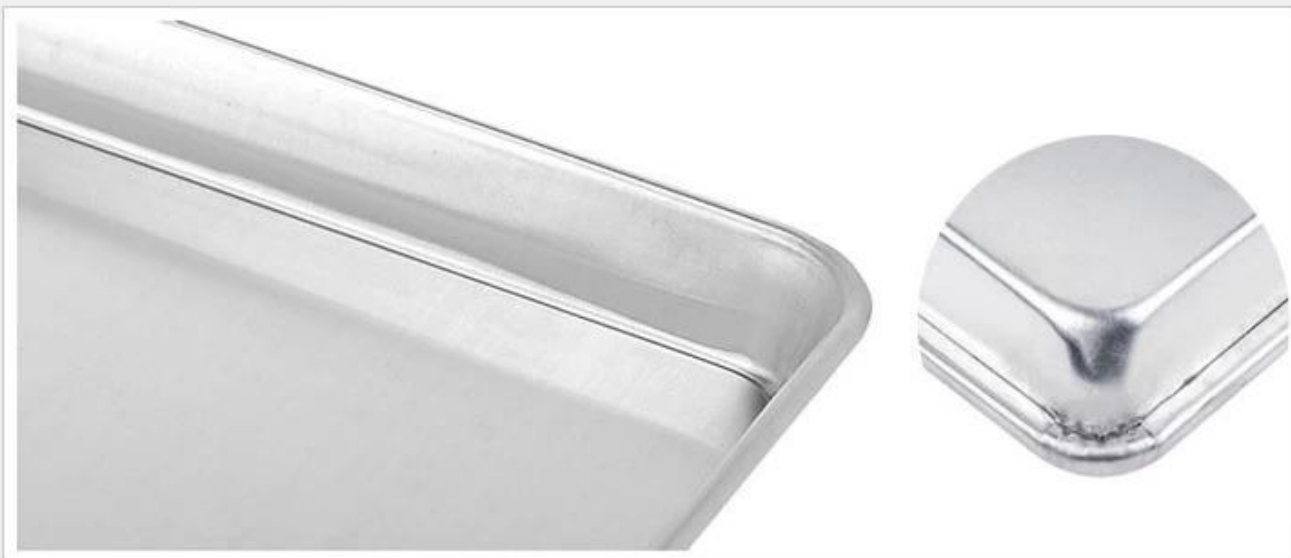
Metal wire in rim for more durable and better bearing