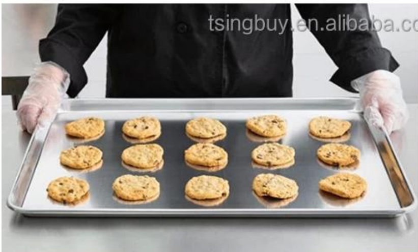
Commercial use in bakery food factory