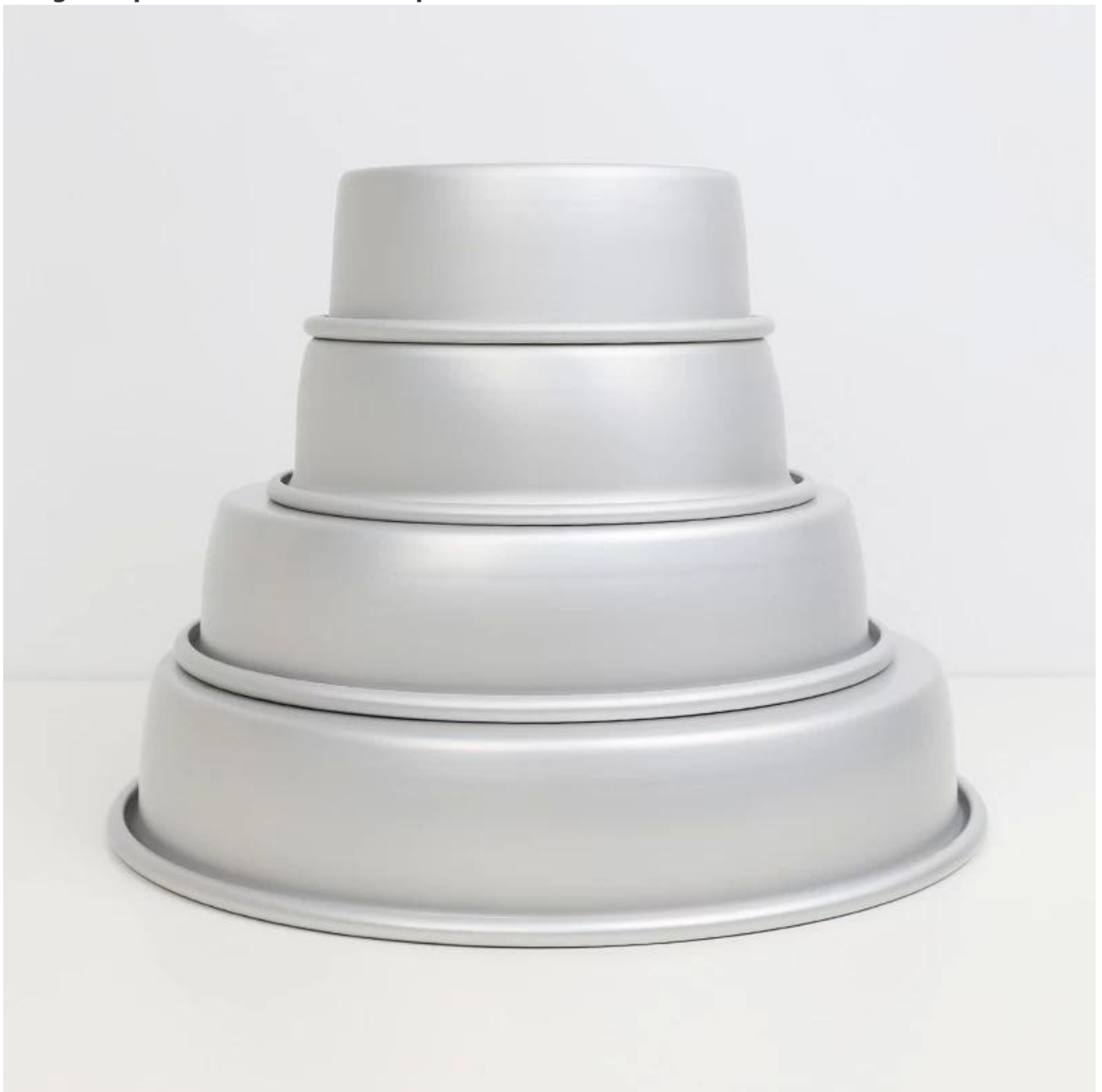
Image du produit de 5/6/8/8/10 pouces