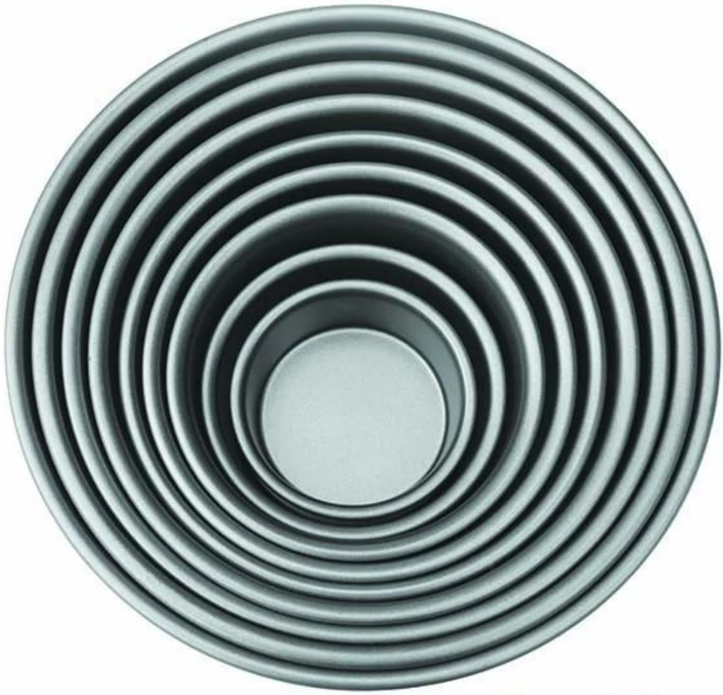
Non-stick costed surface