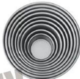
Round Cake Pan ( Anodized )