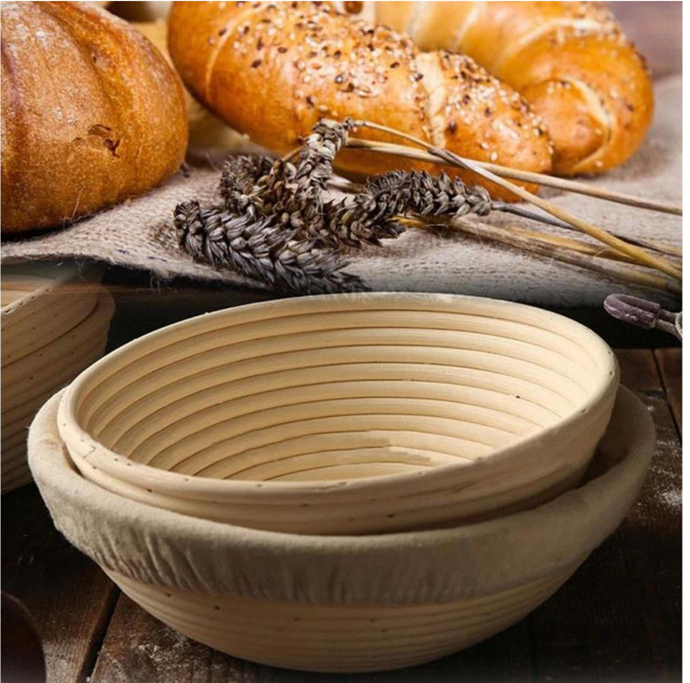
Panier Banneton Factory des photos